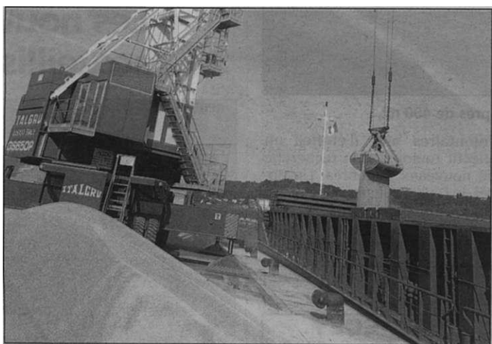
Un des tracés pourrait passer par le Sud haut-marnais.